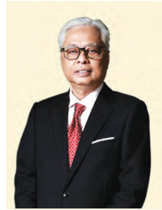
PERDANA MENTERI MALAYSIA

Dengan kadar inokulasi mencapai tahap yang disasarkan dan kesan serius COVID-19 secara keseluruhannya terkawal, lebih banyak sektor ekonomi dan aktiviti sosial dibenarkan beroperasi semula pada separuh kedua 2021. Langkah ini telah meningkatkan potensi bagi pertumbuhan yang kukuh pada 2022. Namun demikian, apabila kita telah bersedia sedia mengorak langkah ke tahun baharu dengan penuh harapan, negara dilanda banjir besar pada Disember 2021 dan Januari tahun ini. Bencana alam ini telah memberikan impak yang besar serta meragut banyak nyawa dan menyebabkan kerosakan harta benda bernilai berbilion ringgit. Meskipun berhadapan dengan kerugian yang besar, bencana tersebut telah mengukuhkan keazaman kita dalam menghadapi cabaran dan mengajar erti sebenar perpaduan, toleransi dan keprihatinan antara satu sama lain seperti yang dicerminkan melalui keberanian dan sikap tidak mementingkan diri #KeluargaMalaysia dalam kalangan semua kaum dan lapisan masyarakat.