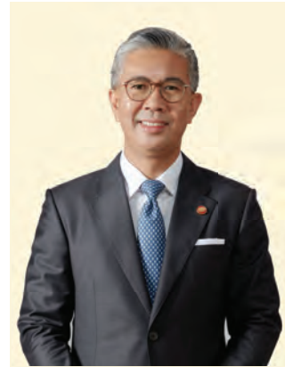
MENTERI KEWANGAN MALAYSIA

Ekonomi Malaysia telah pulih daripada pandemik COVID-19 berikutan kerjasama menyeluruh oleh Kerajaan, sektor swasta dan masyarakat sivil. Ketika negara memasuki fasa pemulihan, ekonomi Malaysia telah berkembang sebanyak 3.1% pada 2021 disokong oleh penambahbaikan permintaan domestik serta pelaksanaan pelbagai pakej bantuan dan rangsangan ekonomi.